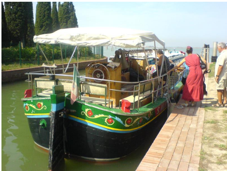
« Il bragozzo... »