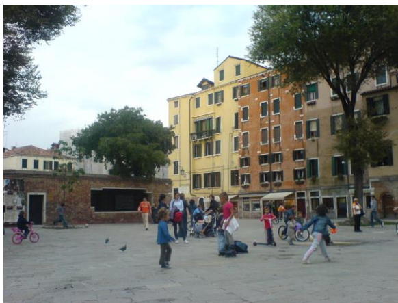
Le ghetto, un lieu populaire.