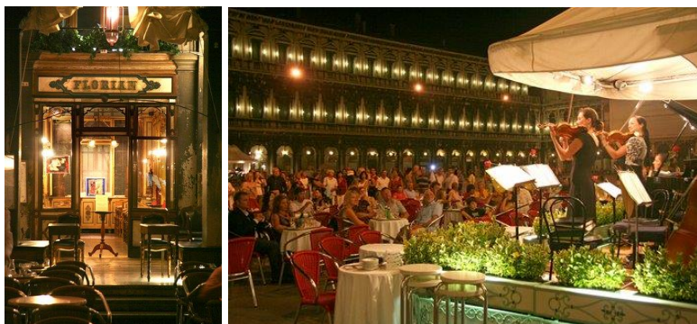
Nuit à Piazza S Marco.

Le soir un dîner sera réservé en restaurant.