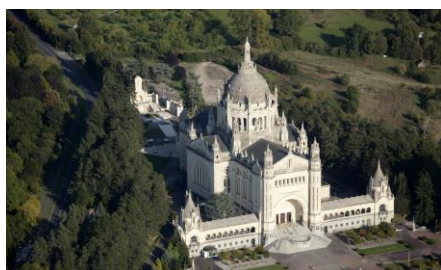
Basilique de Lisieux

Un mini-séjour « tranquille » en Normandie