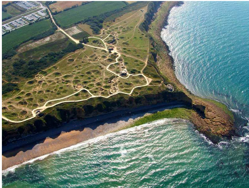
Le site de la pointe du Hoc

Ce fut l'une des batailles les plus difficiles du débarquement : au final, sur les 225 Rangers, seuls 90 d'entre eux étaient encore en état de poursuivre le combat.